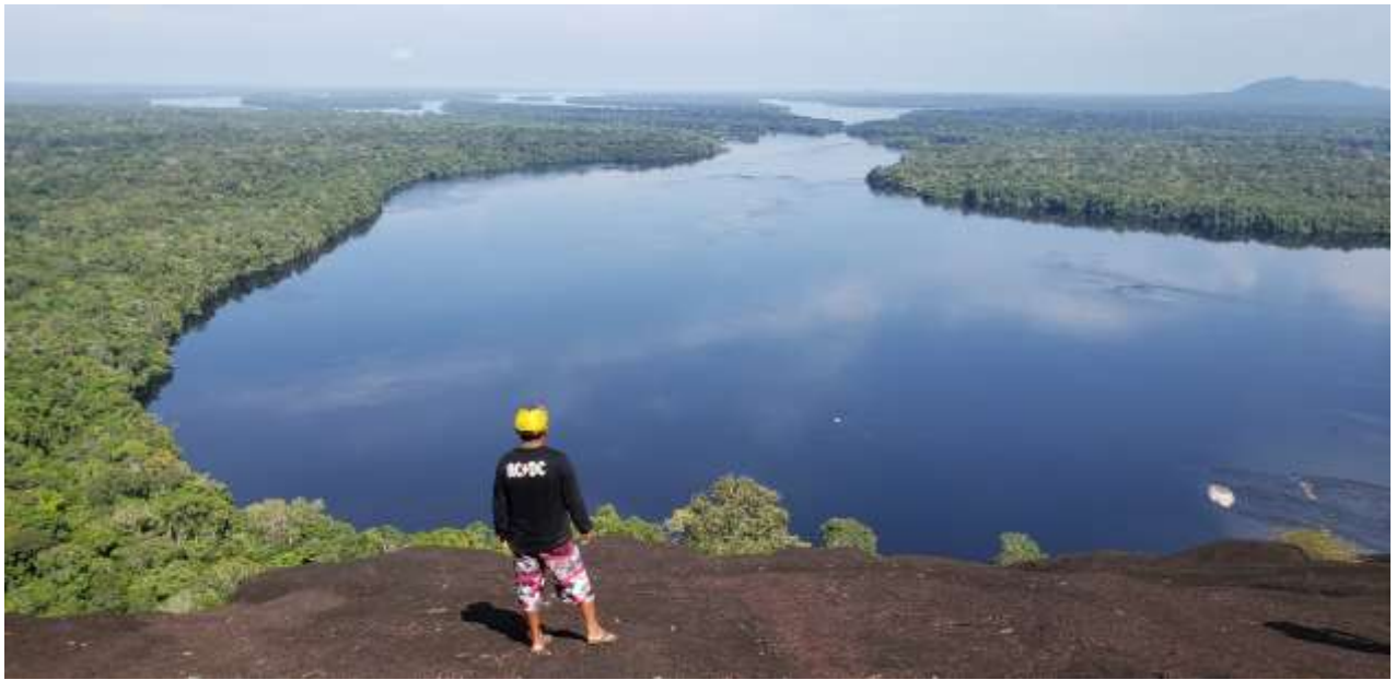
Alto Rio Negro visto da Serra da Jacuraru