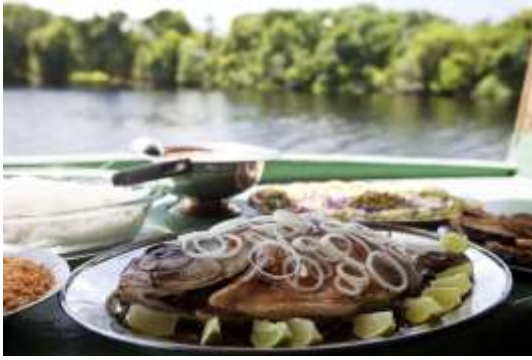
Tambaqui assado na brasa